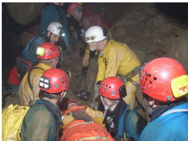
Brancardage au Trou d'Haquin. Photo Spéléo-Secours, Bernard Van Espen, 2012.

Il était à la sortie du réseau (dans le sens entrée vers la salle Tony). Il était très bien entouré par ses collègues (une équipe qui comportait 2 infirmières et qui lui a ramené de l'extérieur de quoi boire, se garder au chaud et manger). Cependant, il ne se sentait plus la force de marcher.