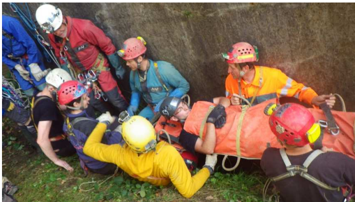
Villers-le-Gambon, 2014.

Les inscriptions peuvent se faire en ligne via http://www.speleosecours.be/formation . Il est possible de modifier son inscription, via le même lien (c'est la dernière qui entre en ligne de compte).