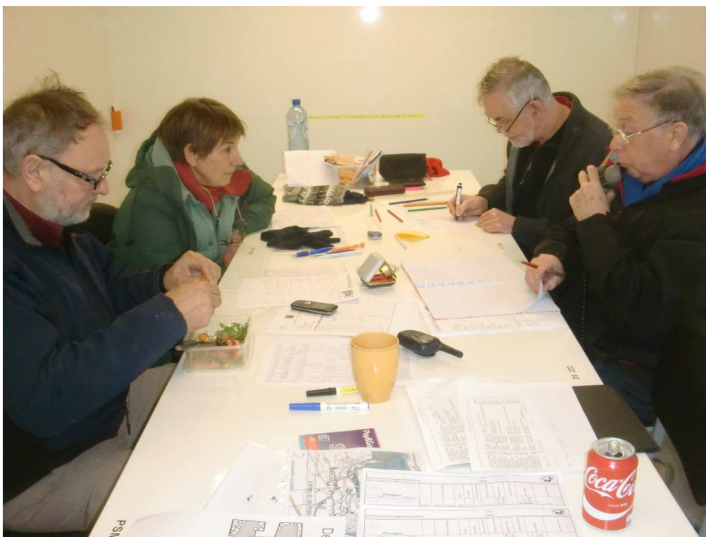
Exercice Plongée, Denée 2016

(*) Les réunions de la commission sont ouvertes aux membres du Spéléo-Secours. Contacter Benoît au préalable.