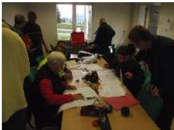
Exercice Garde-Cavale, 2013.

Le trajet se fait par les véhicules personnels et la Spéléo Mobile de Spéléo-J. Nous privilégierons bien