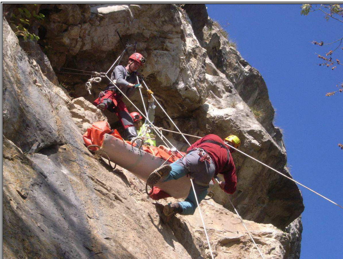
STEF et contrepoids. Roche aux Corneilles. Photo Spéléo-Secours, Bernard van Espen, 2008

Seules les commandes payées seront prises en compte.