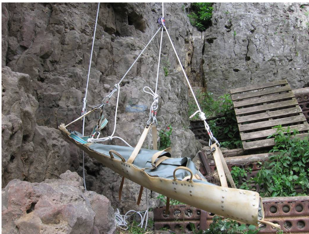
Système Technique d'Equilibrage Facile (STEF) (Permet de monter une victime à l'horizontale)